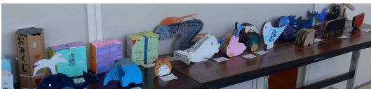
4年生 夏休みの課題