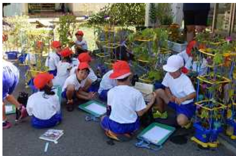
1年生 アサガオ観察

夏休み中に子どもたちが世話をした動物や植物が大きく育ちました。2年敬組のお友達が世話している子ウサギたちも、飼育小屋を元気に走り回っています。