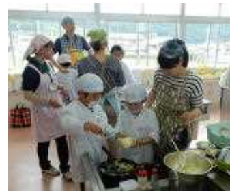
3年 親子クッキング