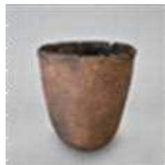
石小屋洞穴遺跡 出土土器

さて、話を先ほどの縄文土器に戻します。この土器のすごいところは、他にもあります。この土器が発見されたのは昭和38年です。当時、世界でもっとも古い土器として日本中の注目を集めました。また、土器のふちに「微隆起線文」という文様がついています。この文様は縄文土器の文様の中でも最も古い文様のひとつです。縄文人もおしゃれですね。そして土器の発明により人々は、肉や魚、木の実や植物を煮たり焼いたりして食べるようになりました。土器の発明で人々の生活スタイルが大きく変わります。最後にこの土器の驚くべき事実を発表します。この土器は、須坂生まれだということです。このちょっと山の方に行った石小屋洞穴遺跡から発見された物です。つまり、われわれのご先祖様は14,000年前に洞穴に住んで、最先端技術の土器をつくっておいしい焼き肉を食べていたということになります。すごいですね。