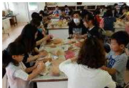
4年 松代焼きづくり